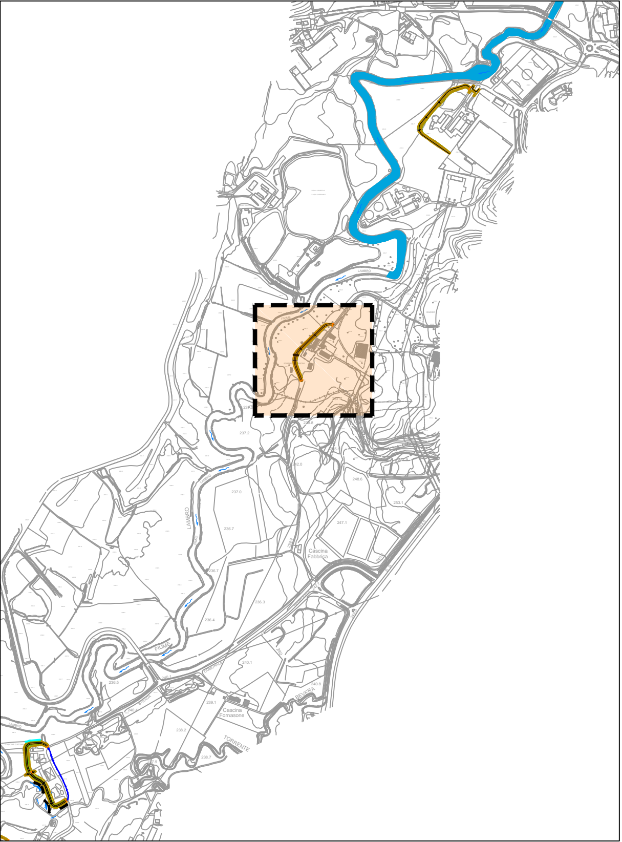
INQUADRAMENTO GENERALE - SCALA 1:10.000